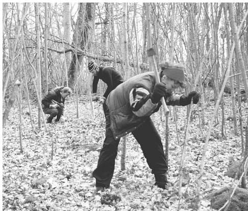
Röjning för naturstigen i Broby äng