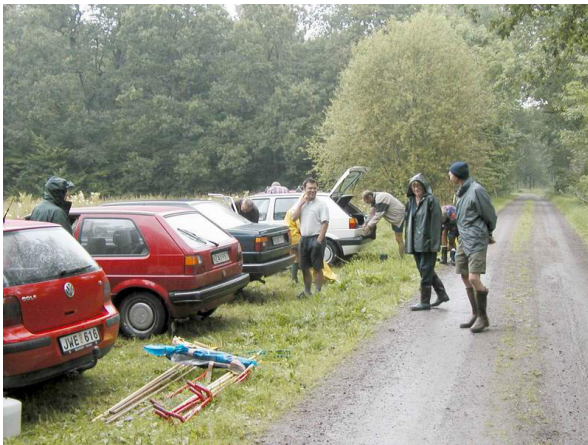
Lite fuktig stämning i början

De senaste två åren har vi kunnat se en buskmus försvinna hastigt när vi närmade oss med liar och slåtterbalk. I år såg vi ingen vuxen mus, men i stället upptäckte vi ett bo med två ungar av buskmus i ängen nära skogskanten. De hade ännu inte öppnat ögonen, utan låg fint inbäddade bland torrt gräs och mossa. Vi beundrade dem en liten stund och bäddade sedan in dem igen och satte upp ett par störar som skydd vid boet och hoppades att deras mamma skulle hitta dem igen.