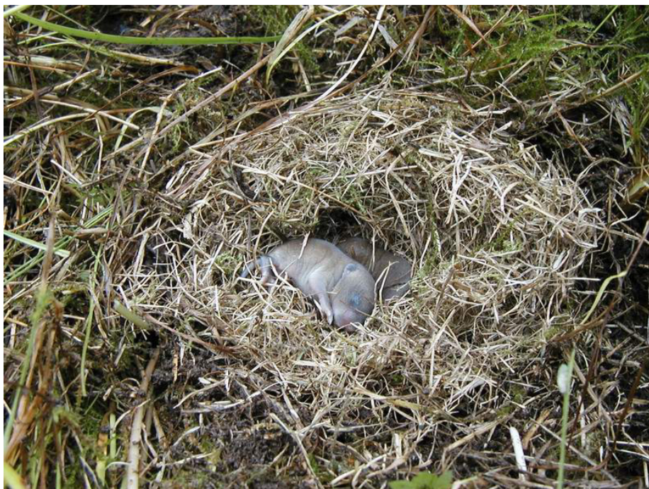
Två små buskmöss i sitt bo i Broby äng