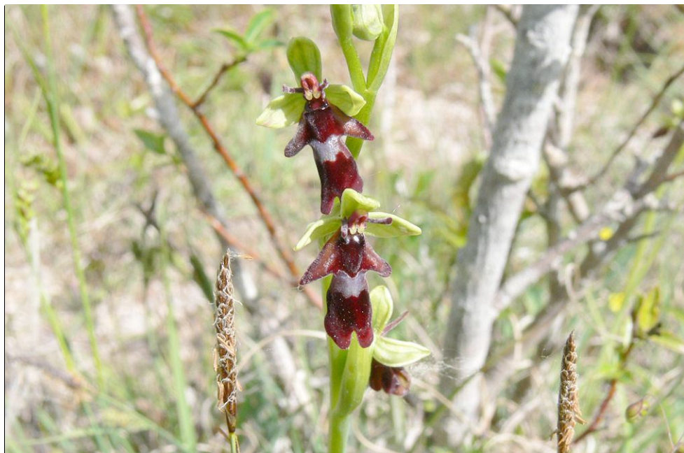
Flugblomsor vid Österplana.