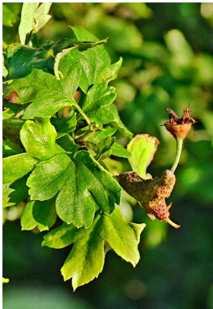
Hagtornsrostens stadium på hagtorn ger karakteristiska ansvällningar på hagtornsgrenarna

Det är oklart hur många olika rotsvarpar, som vi har t.ex. i Närke. Det kan bara nämnas, att jag hitintills påträffat 98 olika arter och angrepp av rotsvamp på 128 olika kärlväxter i landskapet. Men det finns naturligtvis betydligt flera arter att upptäcka.