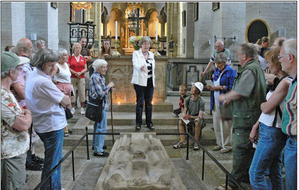
Guidning vid Birger Jarls grav i Varnhems klosterkyrka