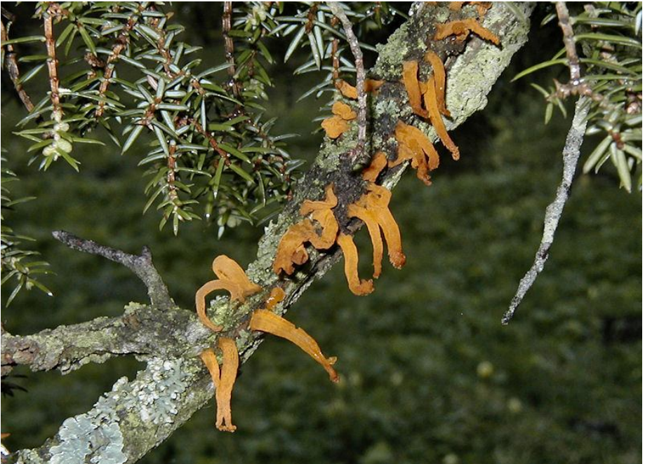
Hagtorsrust på en. Det är mjuka gulorange färgade utväxter från engrenar

De flesta kärlväxter parasiteras av olika rostsvampar. Det stora flertalet är harmlösa, men några få orsakar stora ekonomiska skador. Den mest kända