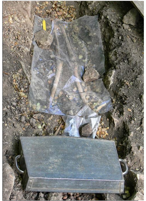
Utgrävning i Varnhem