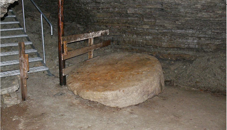
Ämne till kvarnsten som man blev tvungen att kassera

på helt annat sätt, än man väntat, så att stenen kan få betydligt mindre tjocklek, än som beräknats. Icke sällan inträffar ock, att lösgörandet helt och hållet misslyckas, i det att kil-formiga stycken lossna, och det föregående arbetet, nedhuggningen, har då gjorts förgäfvat. Så vida fasta sandstenslager af tillräcklig tjocklek betäcka kvarnstenslagret, undvikes numera oftast, sedan man »kommit till berg», det långvariga arbetet med undanskaffandet af de ofvan befintliga massorna. I stället fortsättes då arbetet inåt i horisontel riktning, hvarigenom grufgångar af betydlig längd och förgrening, s. k. »underhack», småningom bildas. Till förekommande af ras lämnas här och där sandstenspelare kvar, hvarjämte stöttor af groft timmer också måste anbringas. Här i underjorden vid små lampors matta sken bedrifves sedan arbetet delvis äfven vintertid, alldestund temperaturen här är ungefär densamma året om.”