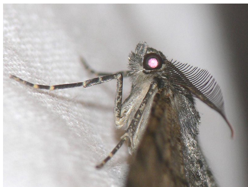
De förgrenade antennerna avslöjar att det är en hane. Med hjälp av dessa ska han upptäcka honan så att det blir fler lövträdsalmätare i Hallsberg nästa år.