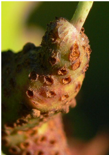
Närbild på ansvällningen. Ur de små kratrarna ska det komma sporer som ska infektera en en