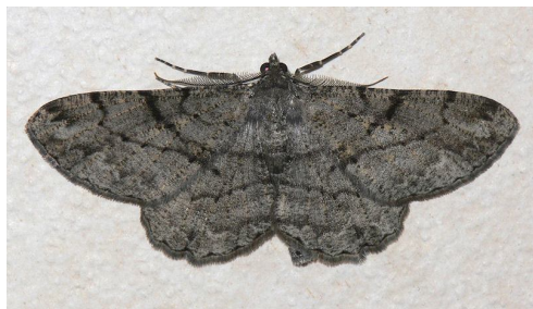
Natten mellan 27 och 28 juli 2008: Fruktträdslavmätare på återbesök i sovrummet.

liten mörk fjäril in innan jag hann stänga fönstret. Den satte sig på min säng och verkade vara nöjd med att ha undvikit ovädret. Men visst såg det ut som om ännu en fruktträdslavmätare hade tagit sin tillflykt till vårt sovrum! Jag hämtade snabbt kameran och fotograferade den lilla fjärilen. Den lilla fjärilen kulle nog klara sig bäst utomhus så jag fångade in den och släppte ut den genom dörren.