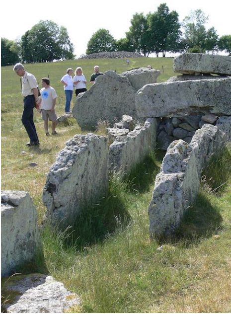
Vid stenkammargravar på Ekornavallen