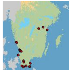
Fynd av lövträds-malmätare rapporterade till artportalen innan augusti -07