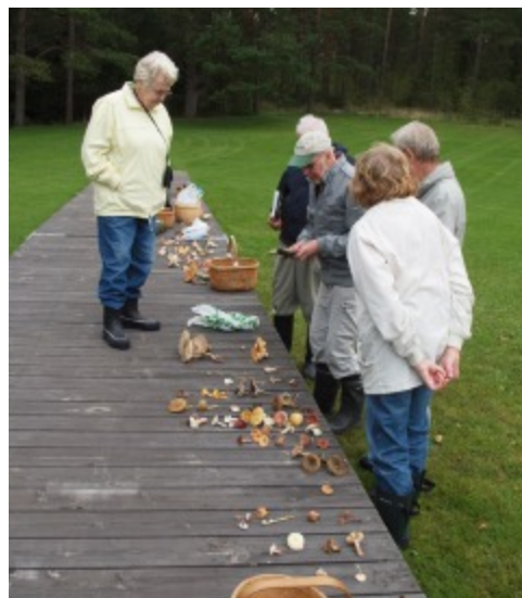
12 sep: Svampar från Runsala på den uppdragna bryggan vid Multen