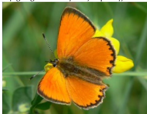
Den vitfläckiga guldvingen hör till familjen juvelvingar