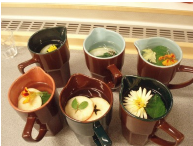
Så här kan drinkar bli både läckra och vackra