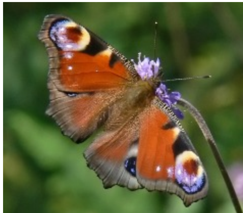
Påfågelögat här till familjen praktfjärilar

Under en dag i maj, en i juni och en i juli gör vi utflykter till lovande fjärilslokaler. Problemet är att fjärilarna bara är ute och flyger när det är vackert väder. Vi måste vara beredda på att anpassa oss.