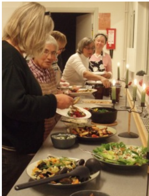
Resultatet av kvällens övning