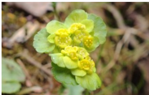
Vi hoppas få se Gullpudran blomma

I höstas besökte vi Runsalaravinen på vår årliga svampexkursion. Det var en mycket positiv upplevelse med bl.a. mängder av svart trumpetsvamp och den ovanliga kruskantarellen. I år gör vi ett nytt besök, när försommarblomningen är som vackrast. På nästa sida kan du läsa om florän i det domänreservat som numera är naturreservat