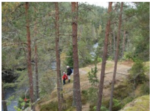
26 sep: Vandring i Dovrasjödalen