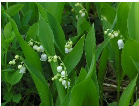
När liljekonvaljerna blommar är det som vackrast i Runsala ravin

I höstas besökte vi Runsalaravinen på vår årliga svampexkursion. Det var en mycket positiv upplevelse med bl.a. mängder av svart trumpetsvamp och den ovanliga kruskantarellen. I år gör vi ett nytt besök, när försommarblomningen är som vackrast. På nästa sida kan du läsa om florän i det domänreservat som numera är naturreservat