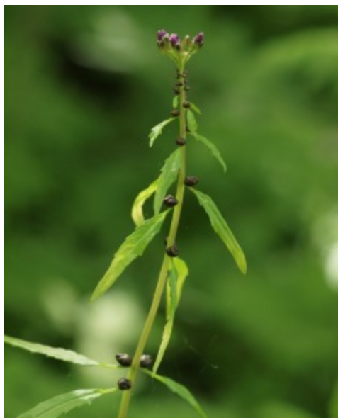
Tandroten kompletterar frösättningen med groddknoppar i bladhörnen