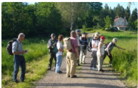
25 juni: På gång mot Nygårds vulkanen. Men om man är naturintresserad finns