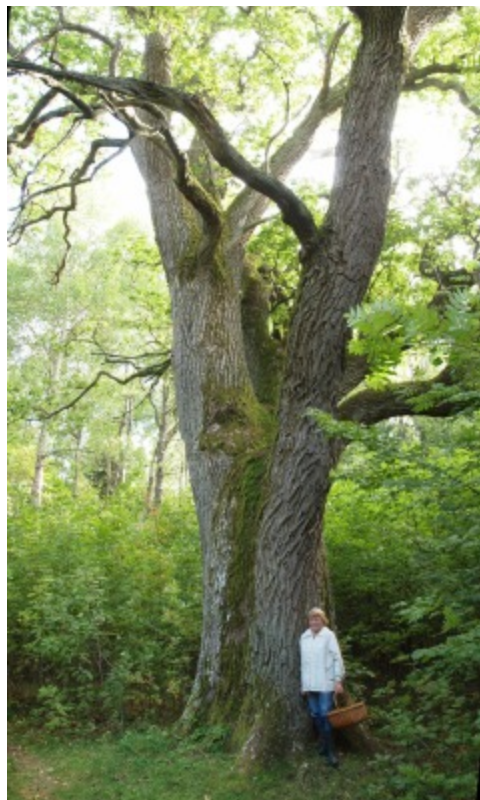
Den största eken i Lerbäcks socken växer i Runsala.