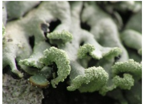
En närbild på kanten av blåslaven visar att det bildas små korn, soledier, som ska sprida laven till nya platser