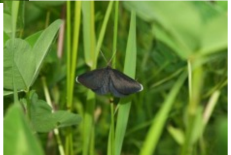
En liten fjärl, en sotmätare.