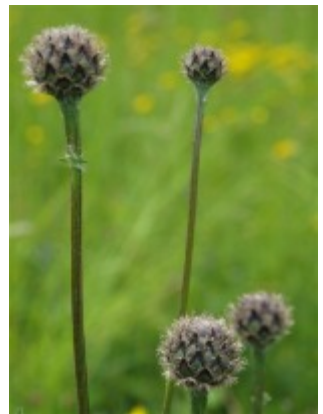
En väddklint som kommer att blomma senare