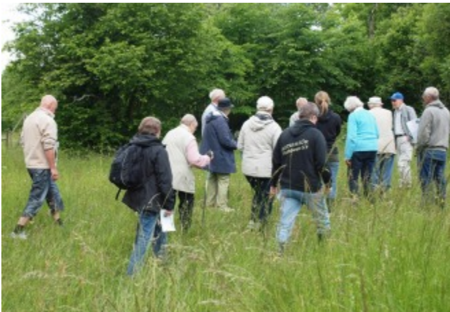
Ett botanikintresserat gäng