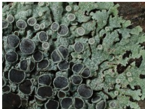
Närbild på dagglaven. De små ljusa prickarna är karakteristiska för denna art

lavens yta. De sporer som bildas där sprids med vinden och hamnar på slumpmässigt vald plats. När sporen grov måste den komma i kontakt med algceller om den ska kunna bilda en ny lav. Detta verkar ju lite chansartat och det finns ofta en alternativ metod för förökning av svamp och lav tillsammans. En metod är att laven bildar små korn av sammanspunna svamphyfer med några