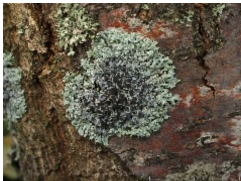
En dagglav på ett plommonträd i trädgården. Denna lav har apothecier på ytan där svampen kan bilda sporer