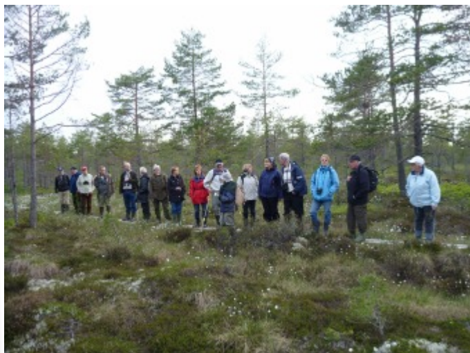
27 maj 2010: På väg ut på Öjamossen

Våra arrangemang sker i samarbete med Studieförbundet