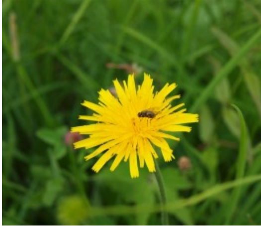
En maskros och en fluga