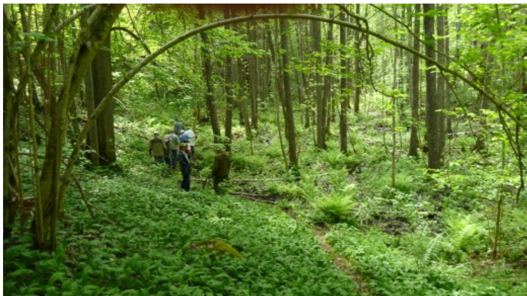
5 juni 2010: Något grönare än Runsala ravin i försommarskrud får man leta efter.