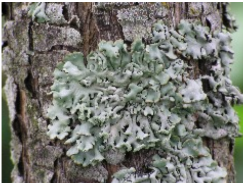
En blåslav på en syren i trädgården. Detta är den vanligaste laven och finns på snart sagt alla träd.

Fortplantningen är ett särskilt intressant problem för laven eftersom den består av två helt obestämda arter. Könlig fortplantning kan bara gälla den ena eller andra arten var för sig. Det har visat sig att algen i lavar aldrig har könlig förökning, utan förökar sig enbart genom celledelning. Svampen däremot har ofta könlig fortplantning. Den sker i små skålformade bildningar (fruktkroppar som kallas apothecier) på