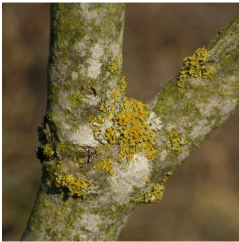
Mångfruktig vägglav från trädgården. Titta i grenvinklarna på närmsta äppleträd. Där finns den säkert