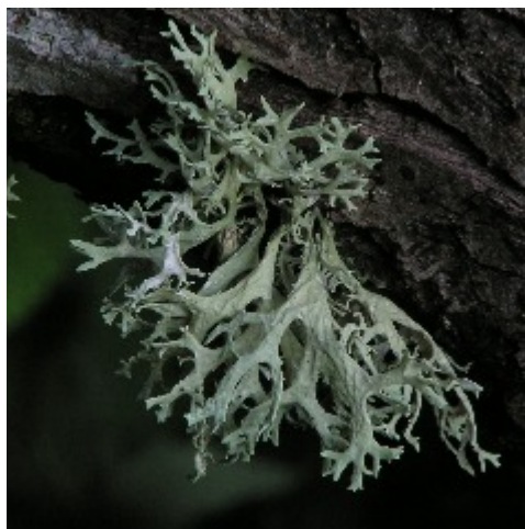
Slånlav i Broby äng. En busklav som känns igen på att ena sidan är ljusare. Syns till vänster i bilden.

algceller inlagda inuti. Dessa korn kallas soresdier. Om de kommer loss och hamnar på ett nytt ställe kan de omedelbart växa ut till en ny lav. En annan metod är att bilda små utväxter (isidier) som lätt bryts av och kan växa ut till nya lavar. En del lavar har ingen utav dessa metoder utan fortplantningen sker genom att en del av laven bryts av och växer ut till en ny lav.