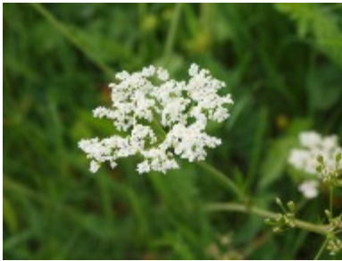
Lite blomsport Är det här kummin eller är det hundkäx