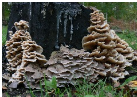
Dallergörppa kallas denna svamp som slagit till på en bränd stubbe.

Kårstahultsskogen är helt unik. Det finns ytterst få områden intill bebyggelse med ett så rikt djurliv, samt med en så rik kärlväxt- och svampflora.