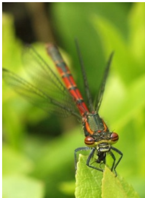
Röd flickslända i Tripphult