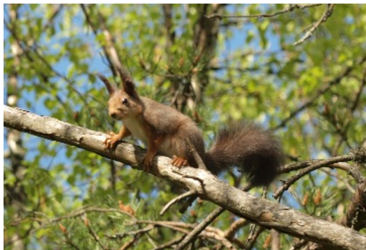
En nyfiken ekorre har överlevt vintern, och är ute och hoppar bland de nyutslagna björklöven

Kommunen har under senare år gått hårt åt trädbeståndet i skogen, med följd att stora delar av skogen numera håller på och växa igen med sly. Det finns trots allt fortfarande en hel del äldre träd av främst gran, asp och björk samt av grå- och klipbal i området. Några gamla tallar har också klarat sig undan motorsågen.