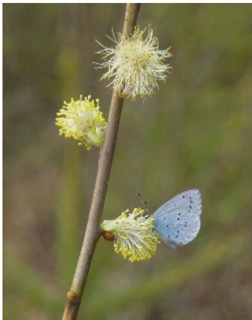
En tosteblåvinge tar för sig av nektarn från en blommande sälg

Vårens stora begivenhet är annars att studera vattensnokarna, när de ligger och solar sig i den så kallade ormgropen, en liten grusgrop intill elljusspåret. Jag vet inte hur många snokar, som man kan se på en gång, men mitt rekord är 14 st.