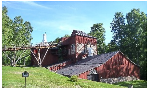
Världsarvet Ängelsbergs bruk var hotat av branden, men klarade sig.