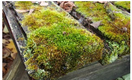
Cypressmossa och spetsig dvärgbågmossa var de första mossorna.

Det gamla bordet får också stå kvar bland buskarna vid den öppna ängen så att vi kan följa vad som händer och vad som kommer och växer på det.