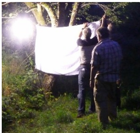
Förberedelser för nattfjärilsstudier