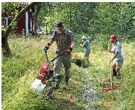
Den nya slätterbalken i arbete

Sture har förnyat listan över innehavare av nycklar till stugan.