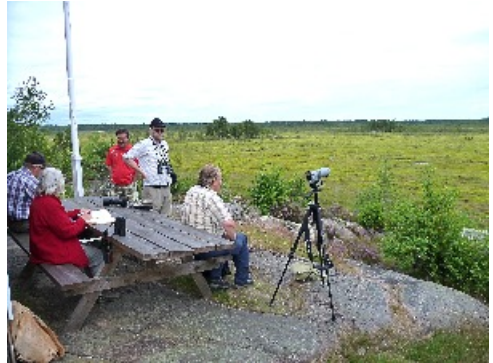
Tänk dig att spana ut i gryningen mot orrspelet nedanför

Det blir flera natur- och kulturreservat bland våra aktiviteter i år. På vår hemsida kan du hitta länkar till internet-sajter där du kan hämta hem broschyrer om dessa områden.