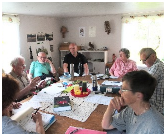
Styrelsemöte i klubbstugan i Herrfallsäng

Styrelsen har under året haft 10 protokollförda sammanträden. I juni och augusti samlades vi i klubbstugan i Herrfallsäng. Vid övriga åtta möten har vi varit på Knutens dagcentral.