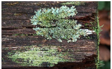
Skrynkellav, upptill i bilden, och en ännu oidentifierad skorplav.