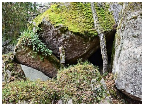
Spännande natur i Skärmarboda