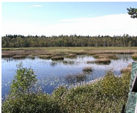
Vad finns i Igeln, vår fågelsjö i skogen?