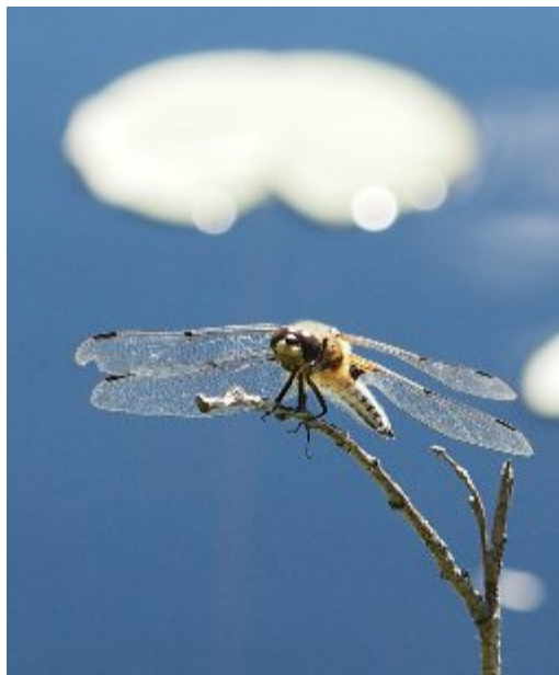
Fyrfläckad trollslända finns vid varje sjö.

Det finns säkert flera trollsländor av de arter som flyger senare. De ska jag spana efter när detta nummer av Anemonen är klart.