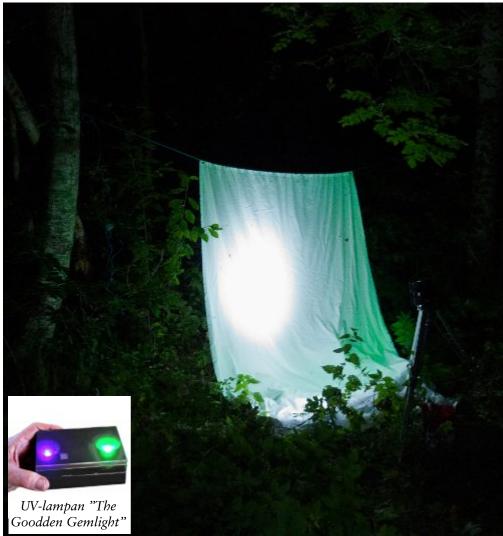
UV-lampan "The Goodden Gemlight"

Mellan 23.30 och 01.30 natten mellan 24 och 25 juli var min portabla nattfjärils-utrustning aktiv i Broby äng.