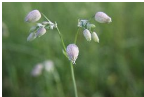
En smällglim på väg ut ur sitt foder. Om man klämmer på blomfodret kan det bli en liten smäll, därav namnet. (A.N.)