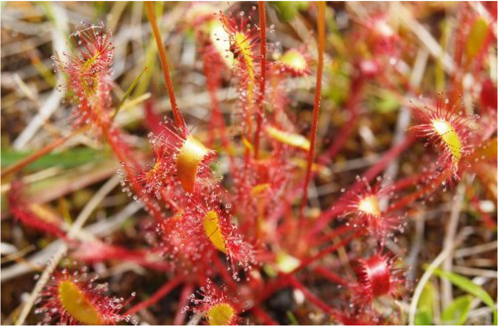
Silesphår (här storsilesphår) växer i fuktiga miljöer. Med sina klabbiga blad fångar de insekter som de suger ut för att få mera näring.