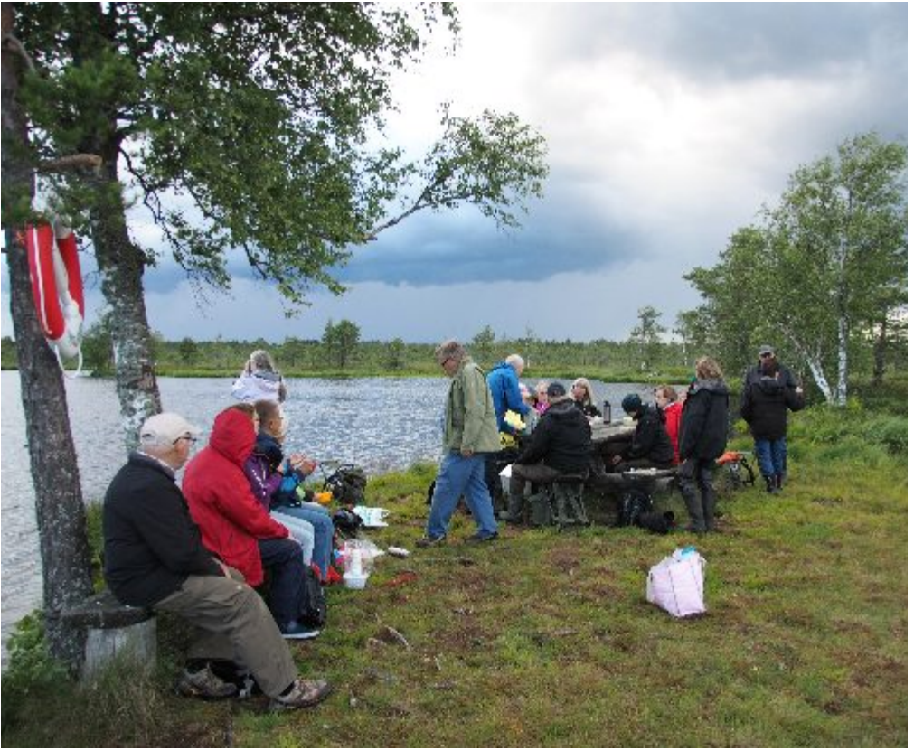
Studiecirkeln tar en fikapaus vid Älgasjön