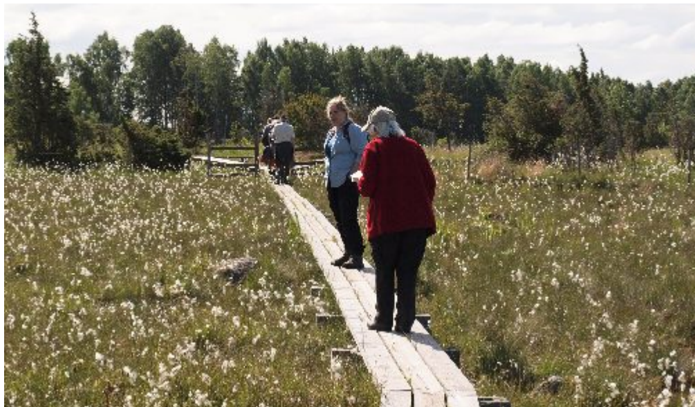
Liksom i Herrfallsäng växer gräsullen i kärret.

Kärret vid Hagebyhöga, norr om Vadstena i Östergötland är ett av de rikaste man kan få se. Dit gjorde studiecirkeln en resa den 1:a juli.