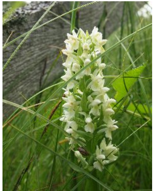
Två av orkidéerna i Hagebyhögakärret: Kärrknipprot och vaxnycklar