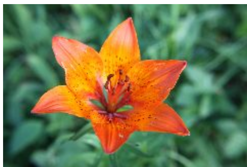
Brandgul lilja En del av blommorna i Herrfallsäng har spritt sig på senare tid. Ibland lite önskat.