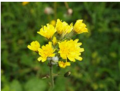
Klasefibbla, en av de ca 300 arterna kärlväxter som noterats i Herrfallsäng.

Första träffarna var i Herrfallsäng som rymmer tillräckligt mycket växter för att hålla en botanist sysselsatt under lång tid.