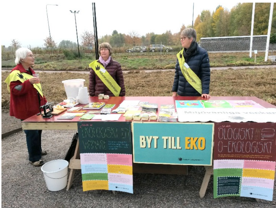
Mera EKO mat(särskilt frukt det året) – äpplesvarvning.

Många olika varugrupper har varit med i kampanjer under Miljövänliga veckan, alltid vecka 40, under årens lopp, t ex mjuk- och smörpapper, små batterier, tvätt-, rengörings- och diskmedel, potatis (King Edvard), kaffe, bananer, jätteräkor, kläder, ekomat, hudvårdsartiklar. Dessa varor är stora konsumtionsvaror och gör verkan om vi försöker göra kampanjer, som påverkar allmänheten.