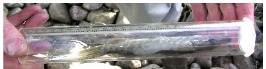
Finns det fisk i Ekoparken och Puttlabäcken? Elfiske i oktober 2003. Bland annat en liten gädda fångades (och släpptes ut igen)