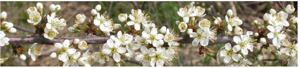
Slånet blommar. Maj 2004