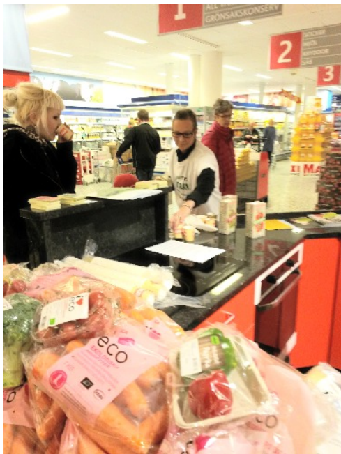
Eco-märkta produkter på Ica Maxi

2016-17 har frågan i Miljövänliga veckan varit hudvårdsartiklar, tvål,