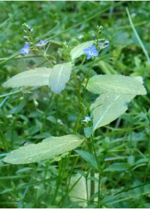
Bäckveronika, med stora gröna blad och blå blommor och källarven med små vita blommor växer också här.