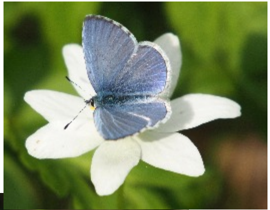
Ovan: En tosteb blåvinge besöker en vitsippa.