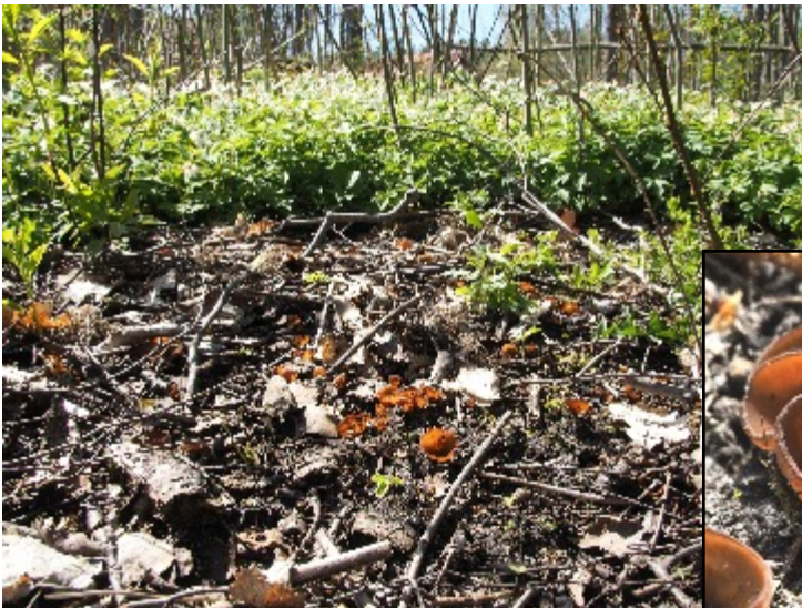
Sippskål växer på vitsippans rötter. Ett sådant bestånd som här ser man sällan, och vitsipporna verkade inte må bra utav detta.