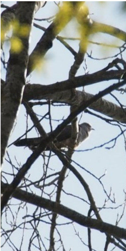
Högt upp i träden gol en gök