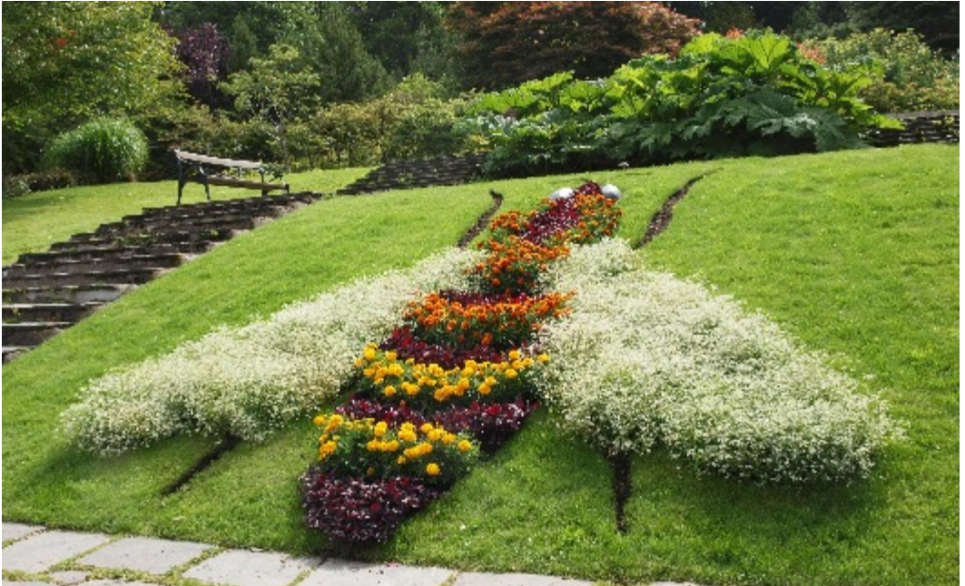
Bilrabatten i Botaniska trädgården

Sommaren har som vanligt varit full av aktiviteter. Vänner har kommit och gått och mycket har jag hunnit med! Det var längesedan jag fick så många bad, som i år. På kvällarna har vi cyklat ner till någon vik och badat och det har varit