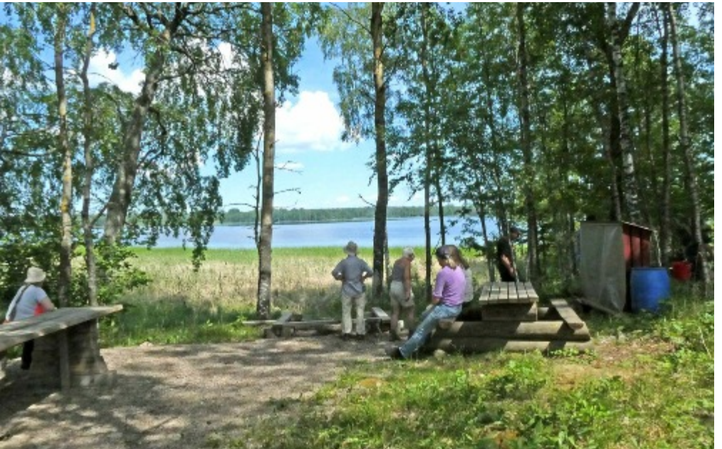
Målet är nått vid sjön Avern