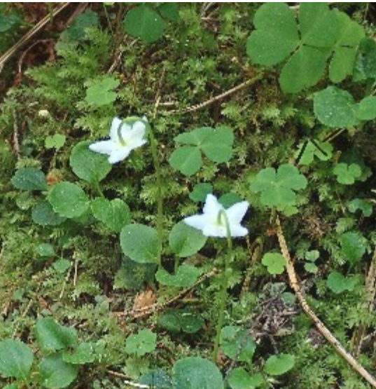
Ögonpyrola blommor längs bäcken från källorna