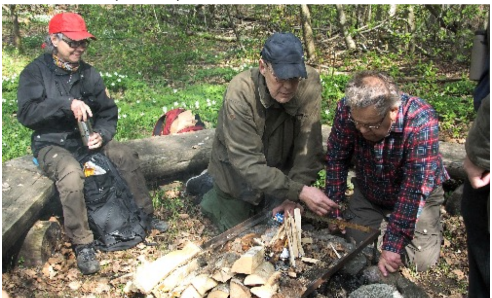
Eldningsförbudet hade ännu inte införts i Örebro län