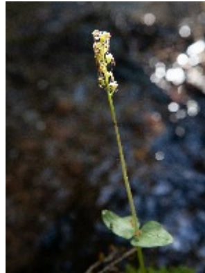
Spindelblomster är en mycket liten orkidé.