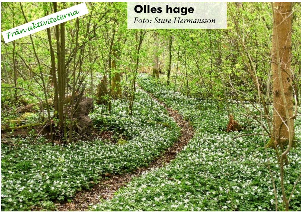
Olles hage är ett kommunalt naturreservat i Asker. Vi besökte det den 6:e maj vilket verkade vara den optimala tidpunkten