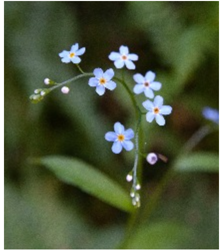
Förgätmigejen blommade vackert