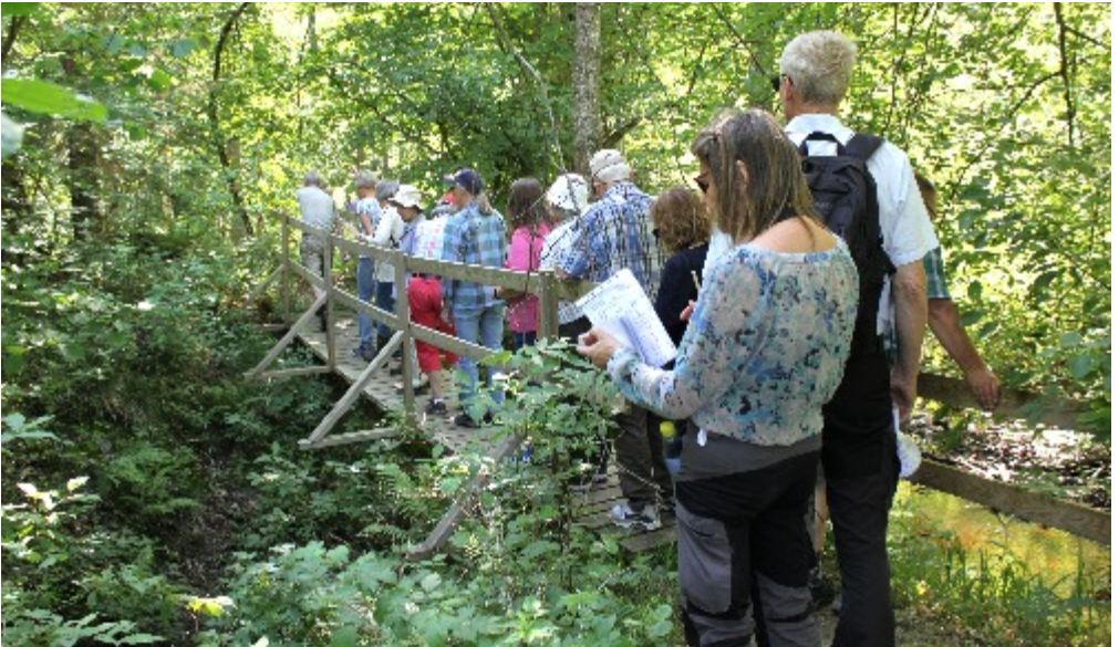
En bro över ån