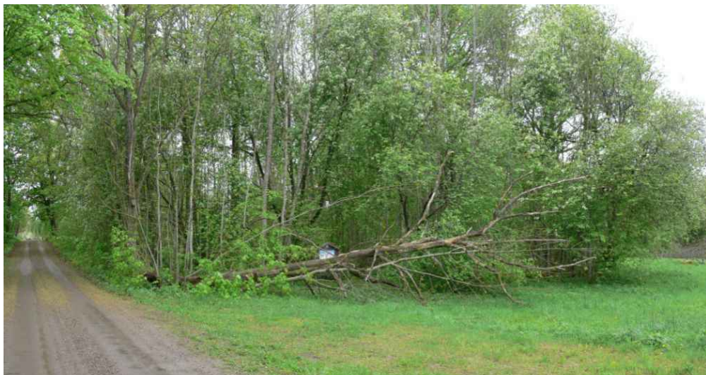
25 maj 2006 hade eken nyss fallit

Någon gång under maj månad 2006 föll en torr ek framför informationsskylten i Broby äng. Den har sedan legat kvar och blivit underlag för olika växter och svampar