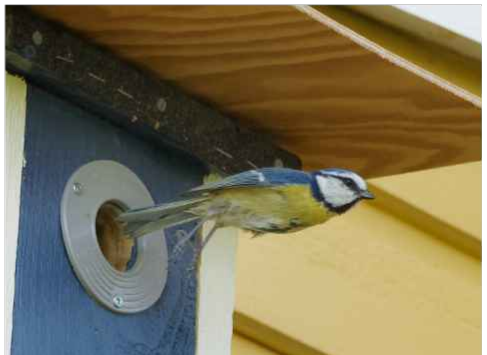
Iväg igen för att hämta mera mat