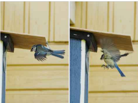
In till ungarna med en elegant manöver

Ungar innebär arbete och med några minuters mellanrum anlände en förälder till holken med mat i näbben. Det extra taket användes till en landningsplats där de kunde göra en sista kontroll att det inte fanns något farligt i närheten.