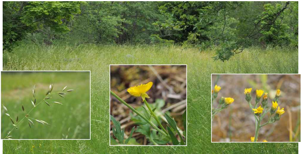
Området dominerades av knylhavre, men där fanns även knölsmörlblomma och kvastfibbla.