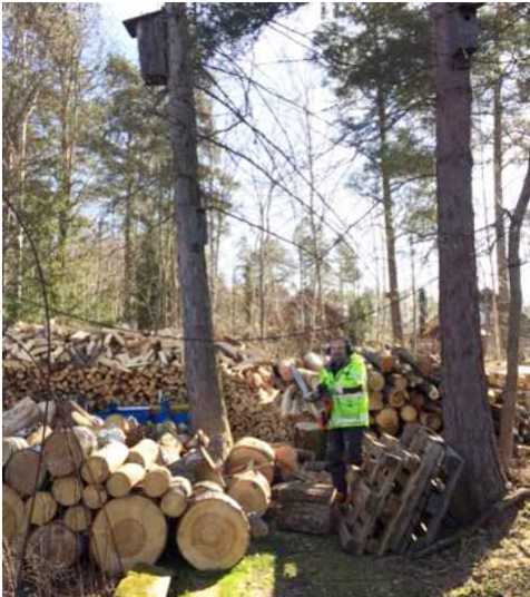
Ugglorna gillar ljudet av vedhantering, holk uppe till vänster i bild