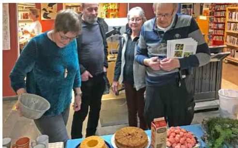
Irene avslöjar fikabordets läckerheter

Boksläppet skedde i Hallsbergs bibliotek och blev till en festlig sammankomst med hjälp av vännerna i styrelsen