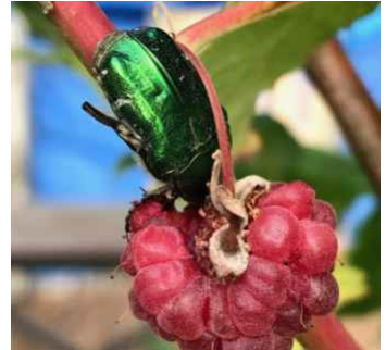
Guldbagge provsmakar hallon