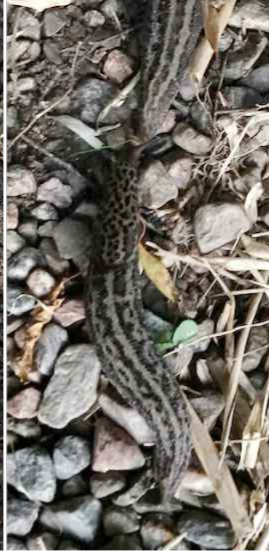
Pantersniglarna har visat sig på många håll och äter troligen små mördarsniglar, eller åtminstone deras ägg.