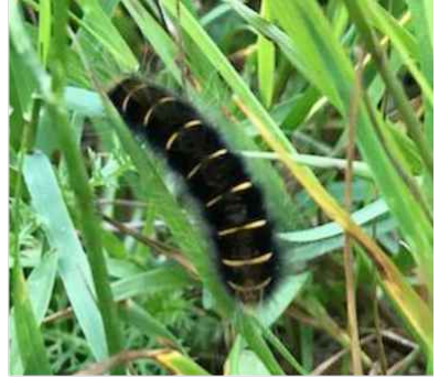
Gräsulv i gräset