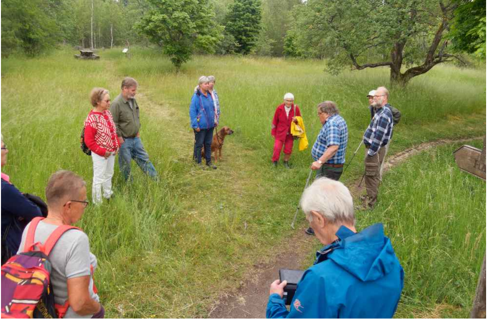
Vi hjälpte till med inventering av floran i ett område vid naturreservatet Hällkistan.