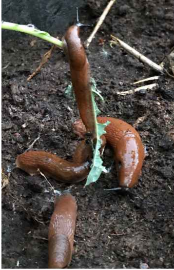
Mördarsniglarna har kålfest i badtunnekomposten.