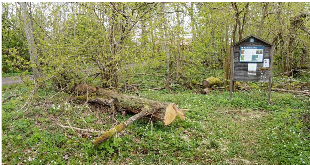
4 maj 2020 ligger ekstammen kvar, men en bit har blivit avsågad och fått en färsk yta