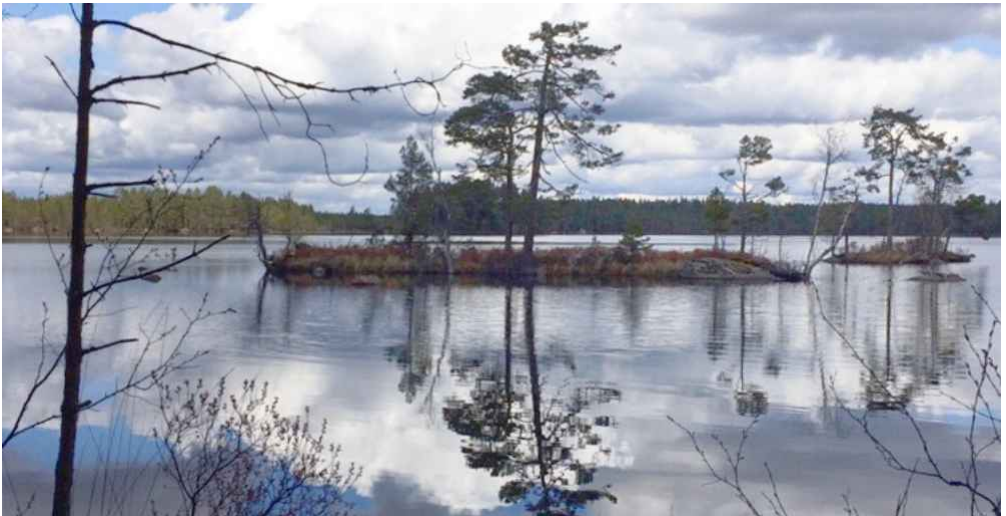
Sjön Gryten vid Vargavidderna