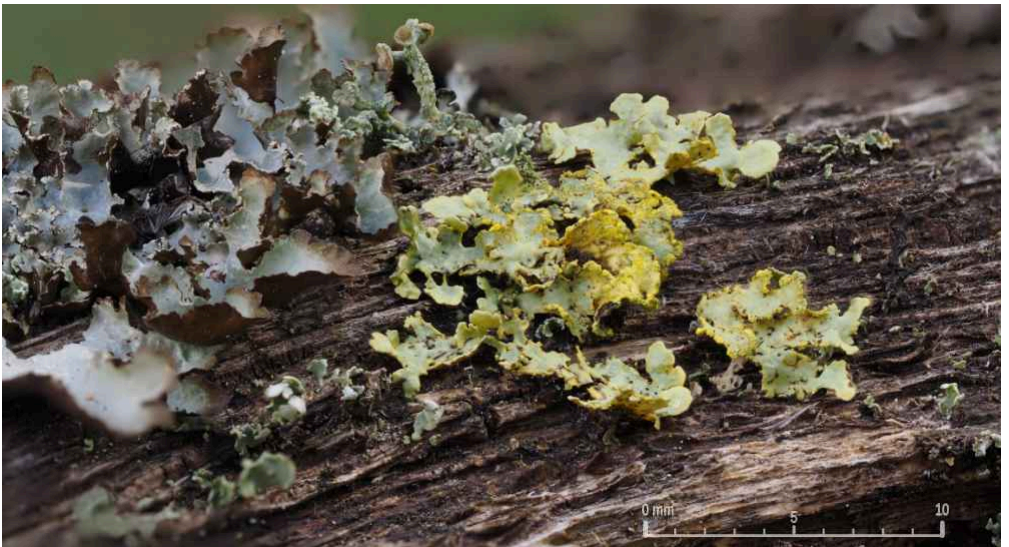
På grenen som hållit upp stammen sedan 2006 växer näverlav (grå) och granlav (gulaktig)