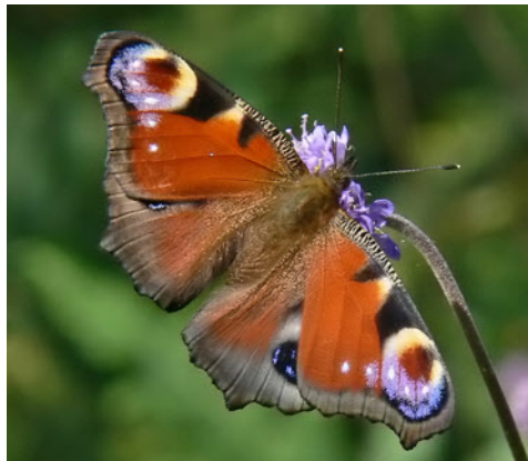
Påfågelögat hör till familjen praktfjärilar

Under en dag i maj, en i juni och en i juli gör vi utflykter till lovande fjärilslokaler. Problemet är att fjärilarna bara är ute och flyger när det är vackert väder. Vi måste vara beredda på att anpassa oss.